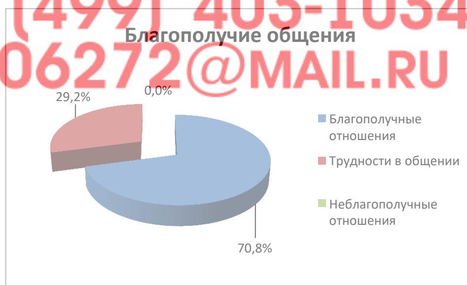
Рисунок 2 - Результаты по критерию «Благополучие общения»

По характеристике «Благополучие общения» трудности в общении испытывают 4 дошкольника или 29%; благополучные отношения и относительно благополучные отношения складываются у 71% или 9 детей (рис. 2). Положительным моментом является то, что в группе отсутствуют дети, у которых складываются неблагоприятные отношения с детьми.