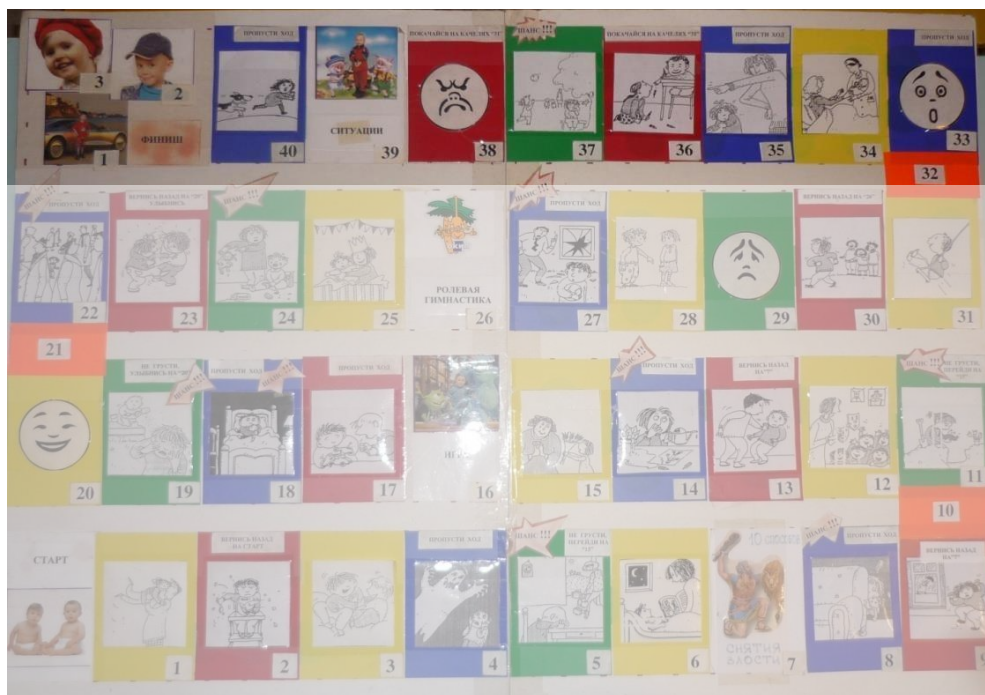
Рисунок 5 – сектора эмоций

быть, если ты потерялся, или боишься, что тебя будут ругать за разбитое стекло и т.п.