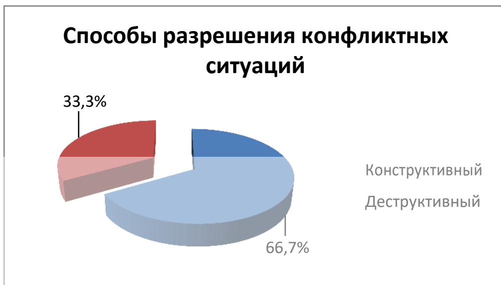
Рисунок 4 - Результаты по критерию «Способы разрешения конфликтных ситуаций»

Развитие межличностных отношений и самосознания ребенка в возрасте 5-6 лет еще интенсивно продолжается. На этом этапе еще возможно преодолеть различные деформации в отношениях с другими, снять фиксацию на самом себе и помочь ребенку полноценно прожить разные этапы возрастного развития. Существуют конкретные психолого-педагогические методы, направленные на гармонизацию межличностных отношений дошкольников.